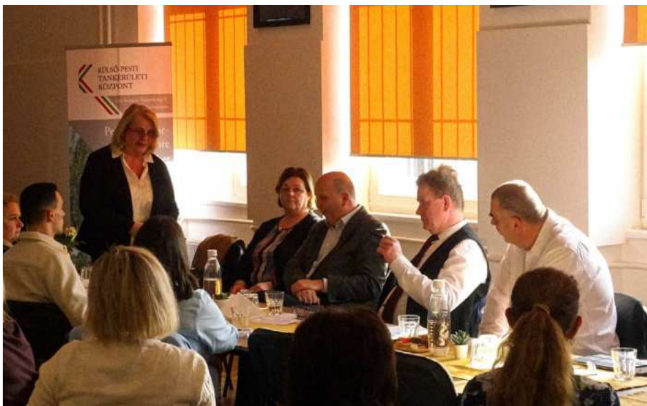
A képen: a XVIII. kerületi gyermekvédelmi szakmaközi megbeszélés

A gyermekek érdekét szolgáló leghatékonyabb együttműködés érdekében szakmaközi megbeszélésre hívtuk a kerületek iskolaigazgatóit, a Rendőrkapitányság vezetőit, a Kormányhivatal és Gyámhivatal vezetőit, valamint a Család és Gyermejköléti Szolgálat és Központ vezetőit. A megbeszélés célja a jelzések minél pontosabb, szakszerűbb körülírása volt, annak érdekében, hogy a gyermek és családja minél hamarabb, minél hatékonyabb, szakszerűbb segítséget kaphasson. Mindannyian elköteleztettek vagyunk, hogy az esetleges bántalmazások, elhanyagolások, a gyermek bármilyen veszélyeztetését előidézö körülmények, melyek akár a családban, akár az intézményben, akár a kortárs csoportban történnek, minél rövidebb időn belül feltárujanak. A szakemberek egységesen képviselték, hogy a hatékony együttműködés adja a kulcsát a veszélyeztető tényezők prevenciójának, a probléma megfelelő kezelésének.